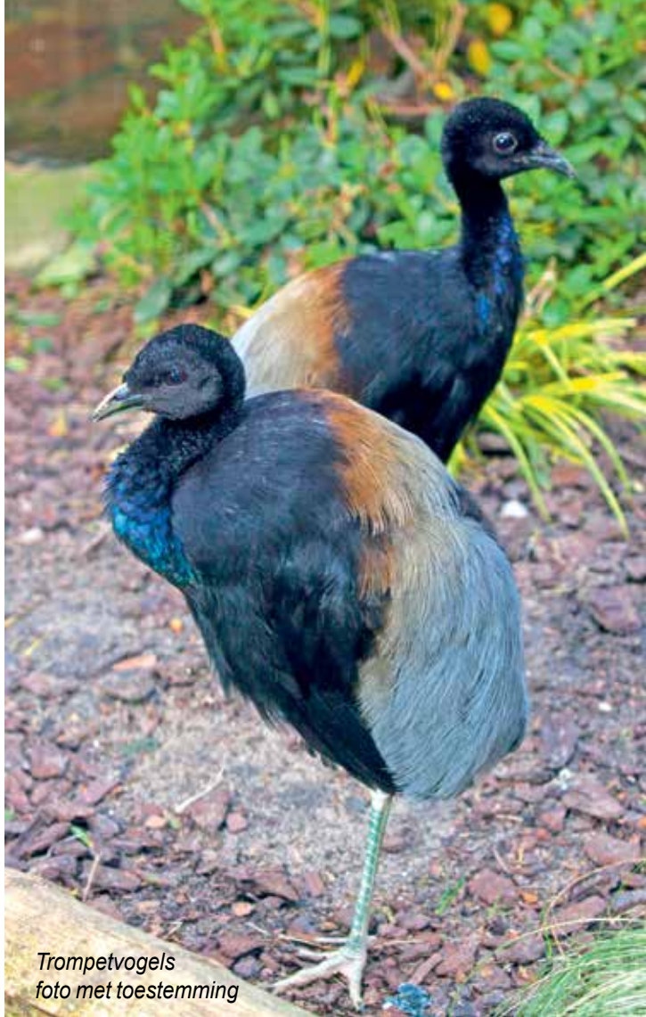
Trompetvogels foto met toestemming