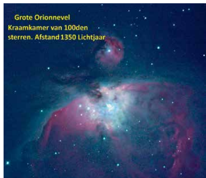
Grote Orionnevel Kraamkamer van 100den sterren. Afstand 1350 Lichtjaar