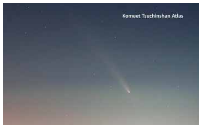
Komeet Tsuchinshan Atlas