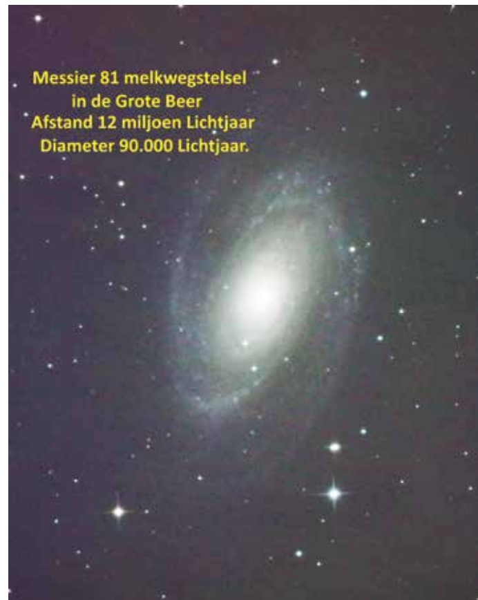
Messier 81 melkwegstelsel in de Grote Beer Afstand 12 miljoen Lichtjaar Diameter 90.000 Lichtjaar.