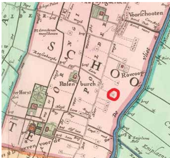
De ligging van het versterkt huis Starrenburg van de heren van Voorschoten in rood omcirkeld. Kaart uit Depot Nationaal Archief.

Wat verder nog herinnert aan De Sterrenborcht is de Starrenburgerpolder en de wijken Starrenburg I en II. Starrenburg III gaat nog gebouwd worden.