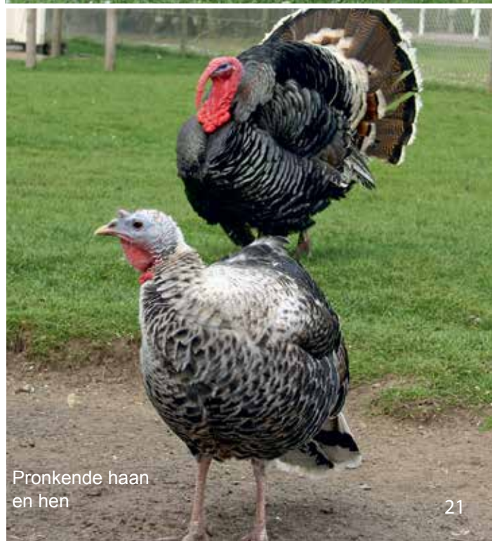
Pronkende haan en hen