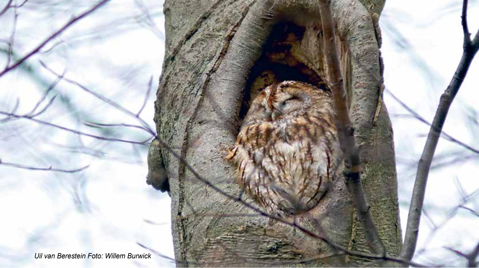
Uil van Berestein